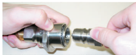
Retração da Capa (luva) de Acionamento