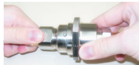
Engate Acoplado e Travado